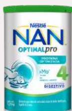
Nan 4 Optimal Pro 1,2 kg