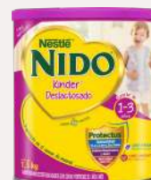
Nido Kinder Deslactosada 1,5 kg