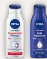
Nivea Regeneración Intensiva o Milk Nutritiva 400 ml