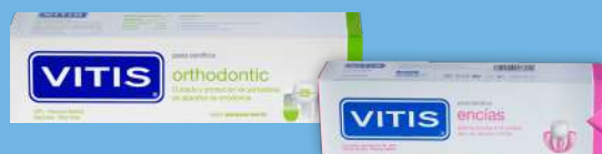
Vitis Orthodontic Vitis Encías Crema Dental 100 ml