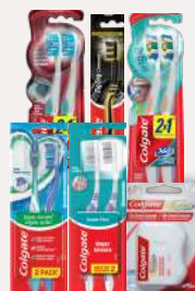
Colgate Cepillos e Hilos Dentales *Consulta Artículos Participantes