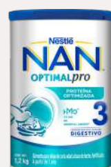
Nan 3 1,2 kg