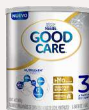
Good Care Etapa 3 800 g