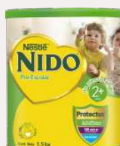
Nido Pre-Escolar 2+ 1,5 kg