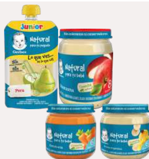
Gerber Variedad Etapa 2 y 3