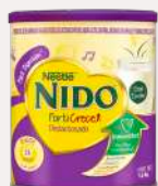
Nido Forticrece Deslactosada 1,6 kg