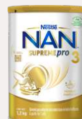
Nan Supreme Etapa 3 1,2 kg