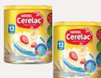
Cerelac 370 g