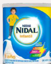
Nidal Infantil 1,5 kg