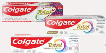
Colgate Total Variedad de Pastas Dentales