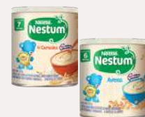
Nestum 270 g