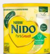
Nido Forticrece 2,04 kg