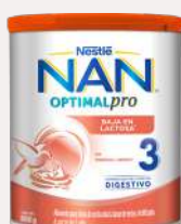
Nan 3 Bajo en Lactosa 800 g