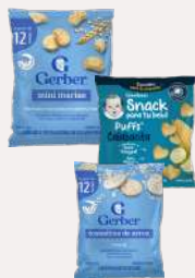
Snacks Gerber Variedad