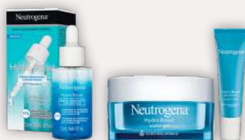
Neutrogena Hydra Boost Gel Cream Eye 15 g Water Gel 50 g Sérum 30 ml