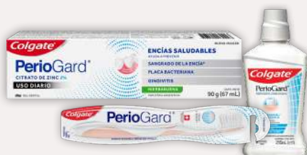
Variedad Colgate Periogard Vigencia al 31 de diciembre de 2026