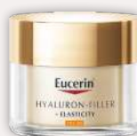
Eucerin Hyaluron Filler Día FPS 30 50 ml