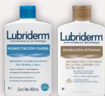
Lubriderm Humectación Diaria o Intense Repair 400 ml