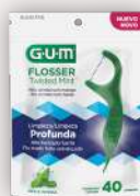
Gum Flossers Twisted Mint 40 piezas