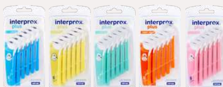
Interprox Plus Cepillo Interdental 0.6 mm, 0.7 mm, 0.9 mm, 1.1 mm o 1.3 mm 6 piezas