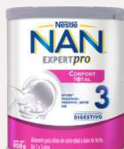
Nan Confort 3 900 g