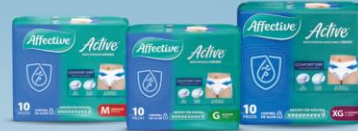
Active M 10 pz o G 10 pz o XG 10 pz