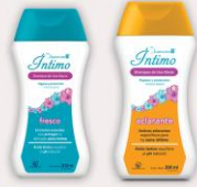
Lomecan Íntimo Shampoo Fresco o Aclarante 200 ml