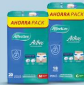
Active M 20 pz o G 18 pz