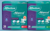
Advanced M 10 pz o G 10 pz