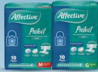
Protect M 10 pz o G 10 pz